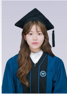
학사모 촬영 (30~40분)