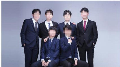
희망자에 한해 우정사진 촬영 (20~30분) 야외 또는 실내 중 선택 하실 수 있습니다. (촬영현장에서 말씀 하시면 됩니다)