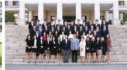
단체사진 (10~15분) 단체촬영을 희망하는 학과는 9월21일~25일 사이 학과 대표님이 카카오톡 pusannalla 으로 신청