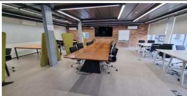
회의실 I (코맥스스타트업 타운1층)