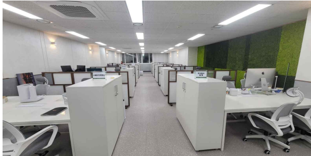
데카콘룸 II (개방형) 사무공간