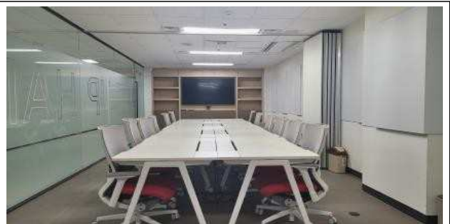
회의실 II (HIT 지하2층)