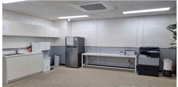
사무공간 내 탕비실