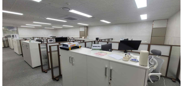
데카콘룸 I (개방형) 사무공간